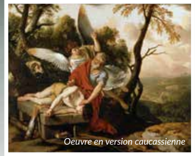
Oeuvre en version caucasienne