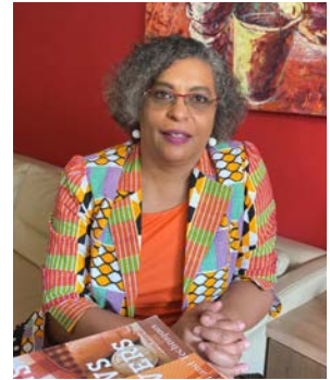
EIA : Quelle est votre vision à 5 ans ?

anticipé la fermeture des écoles à travers le monde. Nous avons aussitôt proposé un programme On-Line. La contrainte majeure a été dans un premier temps la formation des enseignants aux outils. Dans un deuxième temps nous avons misé sur la formation des parents, qui ont été fortement sollicités dans un système de pédagogie progressiste comme le nôtre. Nous avons atteint l'objectif après des itérations normales de temps.